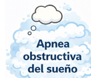
Apnea obstructiva del sueño