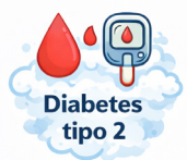
Diabetes tipo 2