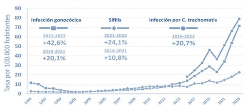
Figura 2: Unidad de Vigilancia de VIH, ITS y Hepatitis B y C. Vigilancia epidemiológica de las infecciones de transmisión sexual, 2023. Centro Nacional de Epidemiología, Instituto de Salud Carlos III/División de Control de VIH, ITS, Hepatitis Virales y Tuberculosis, Dirección General de Salud Pública y Equidad en Salud; 2024.

"Cada día, más de 1 millón de personas, contraen una ITS 1 , son PREVENIBLES Y TRATABLES. "