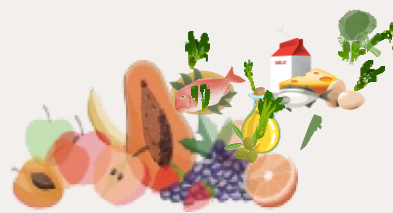
Imagen. Recomendaciones. Consultado Abril de 2023. [Internet] Disponible en: www.canva.com